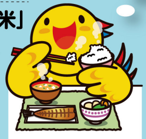
兵庫県マスコットはばたん