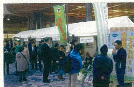
東京の有楽町におけるマルシェ (令和元年12月)

「ディスカバー農山漁村の宝」に選定された地区に対しては、選定証の授与を行います。また、農林水産省ホームページ等で活動を紹介するほか、様々なイベントへの出展支援を通じて、全国的な情報発信を行います。コロナ禍における第7回選定では、選定地区の地域産品や取組を特設ウェブサイト内で紹介し、全国へ幅広く発信しました。