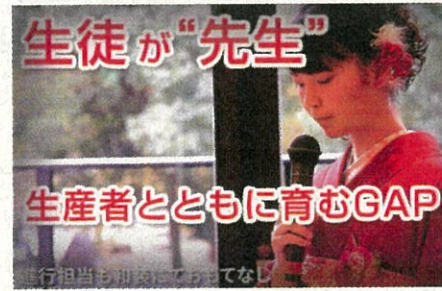
特設 Web サイト内取組発表ページ