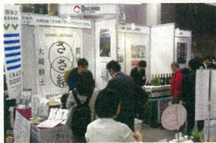
アグリフード EXPO 大阪 (令和2年2月)