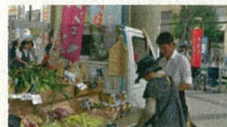
軽トラによる移動販売