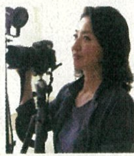
織作峰子 大阪芸術大学教授 写真家